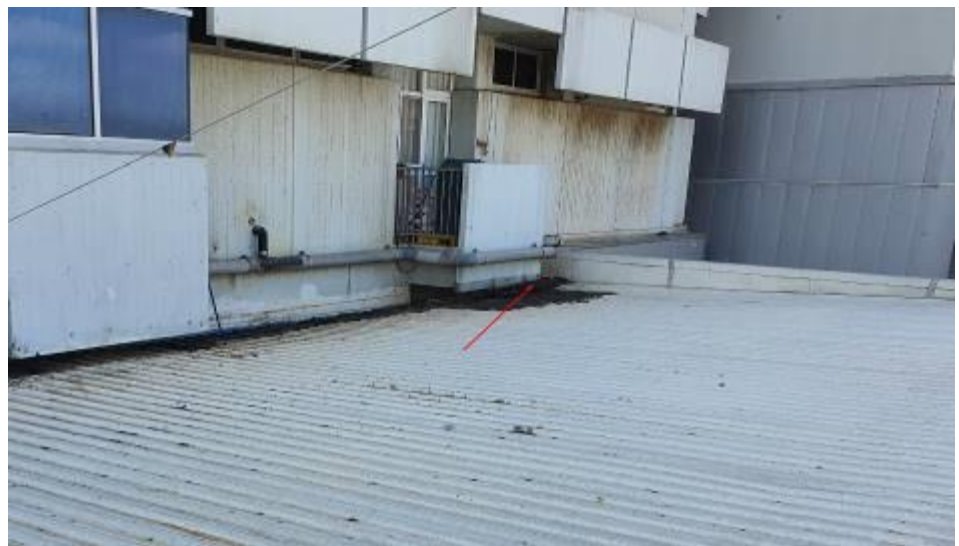
מיקום צינור אחד

מטרת צינור זה הוא לשמש כניקוז חרום שימנע חדירת מים אל תוך המבנה במקרה של הצפת תעלת הניקוז.